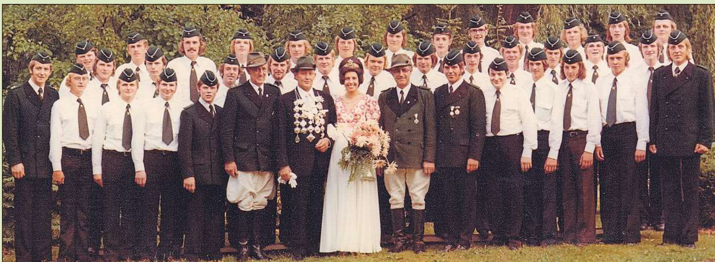
1973 und somit vor 50 Jahren wurde die Kompanie der Jungschützen der St.-Lambertus-Bruderschaft gegründet. Zum goldenen Jubiläum gratuliert der Verein herzlich.