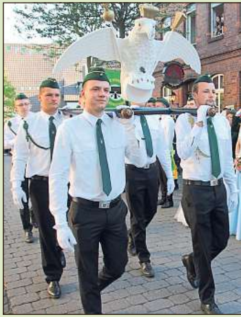
Wenn der prächtige Holzadler zum Schützenplatz getragen wird, ist das stets ein besonderer Moment.