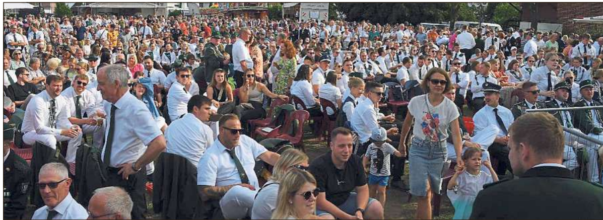
Volles Haus: Über mangelndes Besucherinteresse konnten sich die Langenberger Lambertusschützen am Wochenende wirklich nicht beklagen. Vor allem beim Vogelschießen platzte der Festplatz aus allen Nähten.

Vogel fällt um 18.41 Uhr nach spannendem Wettkampf