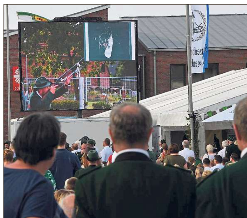
Nervenkitzel: Die zahlreichen Zuschauer konnten das Geschehen unter der Vogelstange auf einer Großbildleinwand live verfolgen.

Weitere Fotos im Internet: www.die-glocke.de